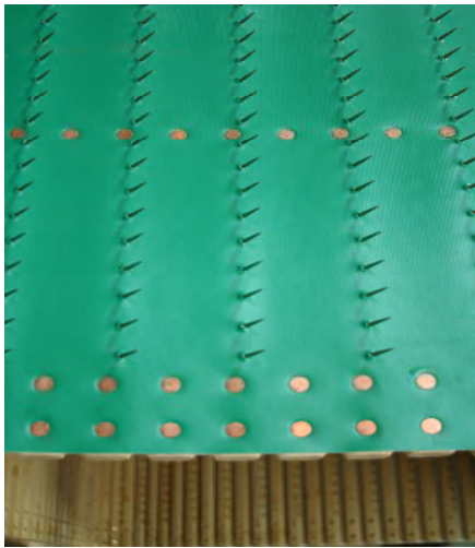
シート付スパイクラチス