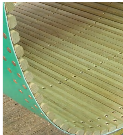
開毛、開織機用シート付ラチス

※ その他、レアーラチス等のような 要望もご相談ください、専門 要員が 打ち合わせをさせていただき、対応させていただきます。