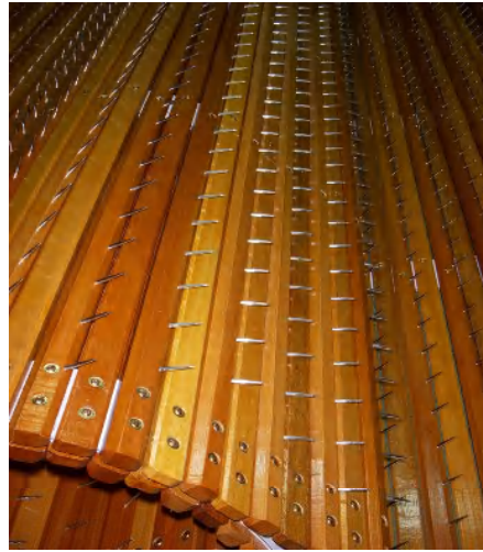
カードホッパー用スパイクラチス